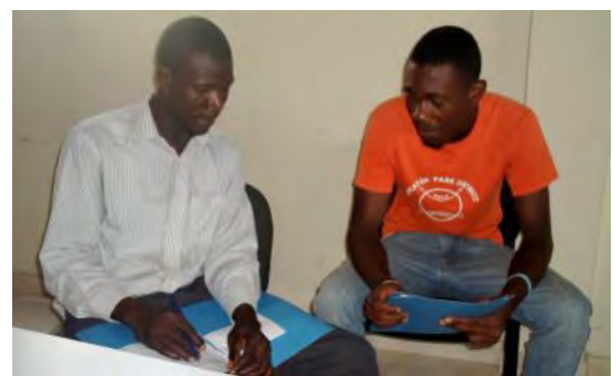
Deux stagiaires en exercice de simulation

Il se poursuivra avec les enjeux du développement local.