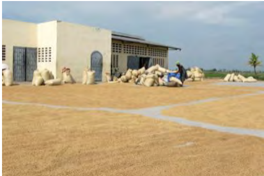
Un PCD pour harmoniser le développement du territoire communal. Ici la ferme rizicole « 3 bornes »

Si l'intervention du GAFE à Desdunes remonte à 2007, celle de l'AFHAD de Nantes remonte quant à elle à 1994.