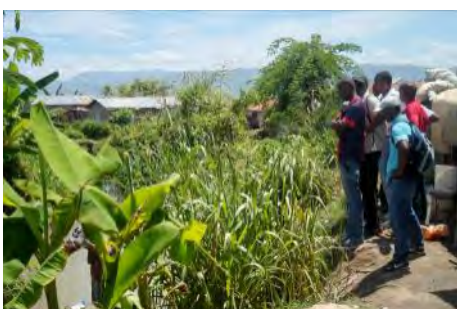
Visite de la zone des travaux par les élus