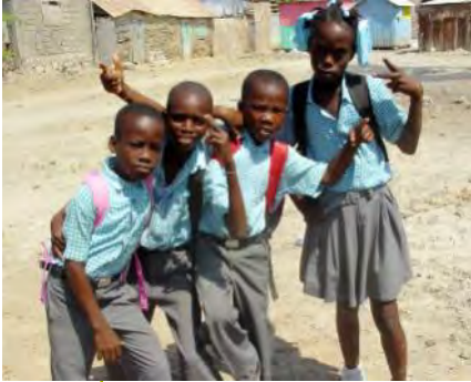
Enfants de la « Word culture »