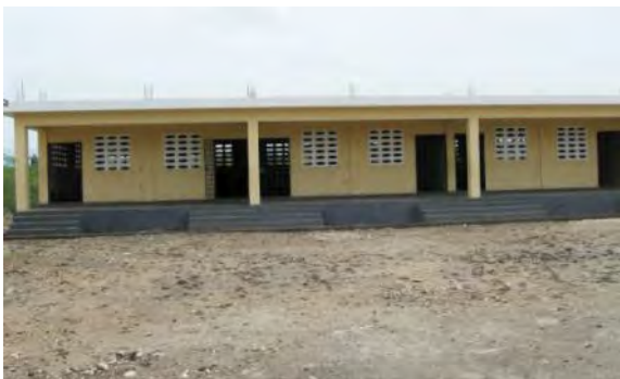
Des arbres pour la grande cour de l'école d'Aux Sources ?