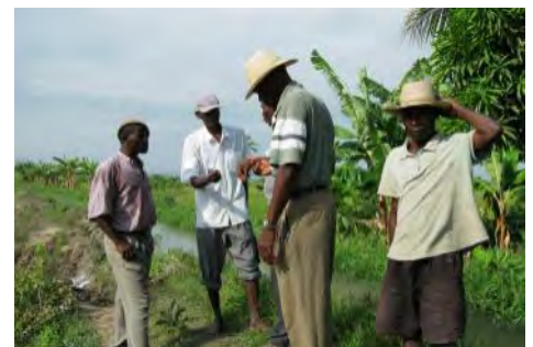
Evaluation initiale en avril 2010

Le 29 août, le GAFE a présenté au CGC le superviseur des travaux, l'Ingénieur Ronald Myrville, spécialisé dans ce type d'intervention.