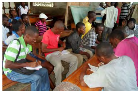
Inscription des candidats au CLC de Duclos

Après négociations, discussions, débats (parfois houleux!), chaque localité a accouché d'un CLC.