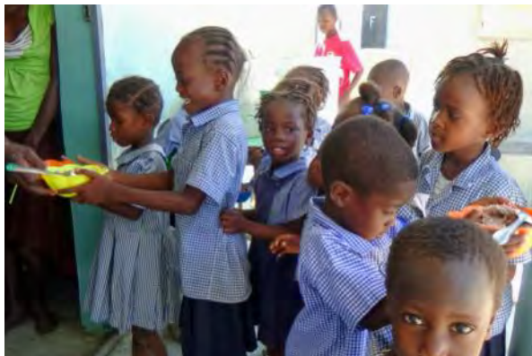
Service des repas à la cantine de Modèle

Cette action a été réalisée en avril, mai et juin 2013. Elle fait suite à l'évaluation du programme de parrainage réalisée en mars 2013.