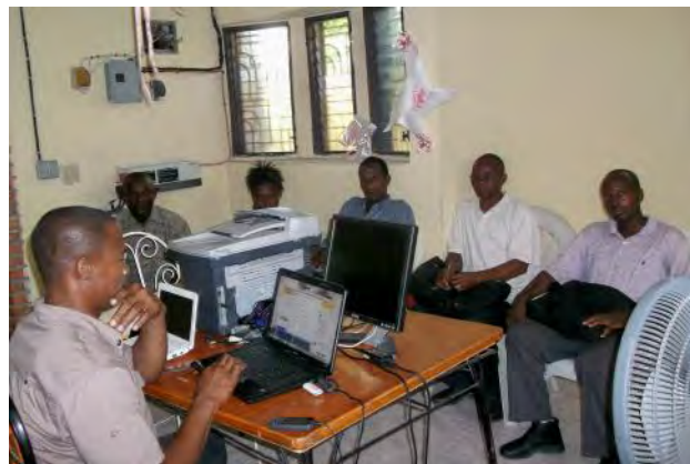
Réunion des directeurs au bureau de l'AFHAD

La rentrée scolaire s'est faite le 6 octobre, à l'exception de l'école de Duclos dont l'ouverture a été retardée d'une semaine car elle était en travaux.