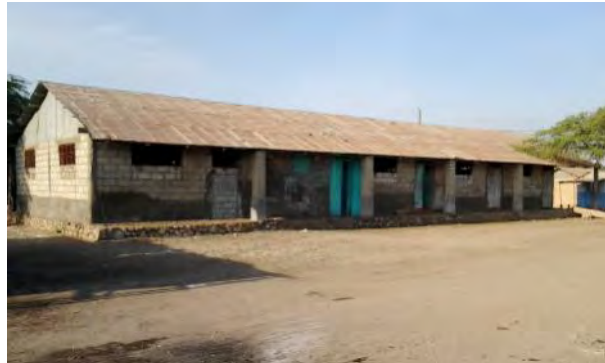
Bâtiment de l'école de Descahos, avec la cour non clôturée, ouverte sur la rue.

Trois écoles sont dans une situation matérielle particulièrement difficile :