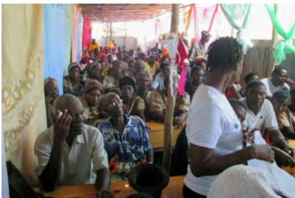
Réunion publique au village de Modèle

Les réunions publiques font partie des outils de communication et d'animations territoriales prévus dans le projet.