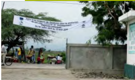
Enquête : Large communication sur la commune: banderoles, affiches, radio

Chaque enquêteur devait remplir 250 formulaires, pour obtenir un total de 4 500 à traiter.