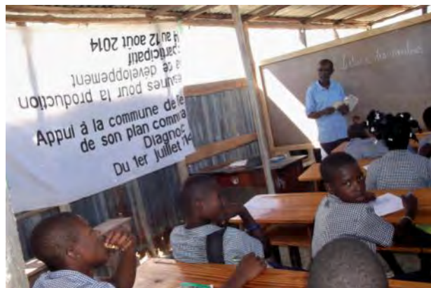
Rentrée scolaire 2014 - 2015 à l'école de Modèle

« Ce partenariat profite collectivement à toute la communauté villageoise »