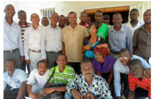
Les membres du CGC

un représentant de la police nationale d'Haïti et un juge de paix.