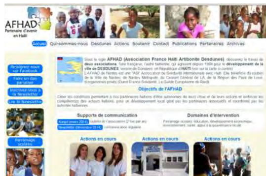
Le site de l'AFHAD : www.afhad.org