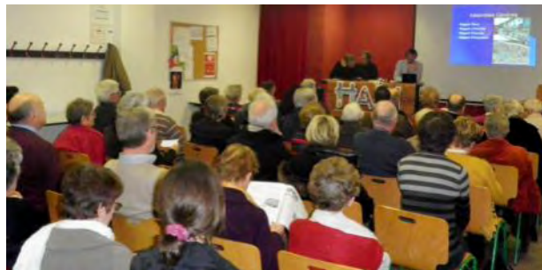
Notre Assemblée Générale de février 2011

Au cours de cette AG, nous organiserons une conférence audio, en direct, avec nos partenaires de Desdunes.