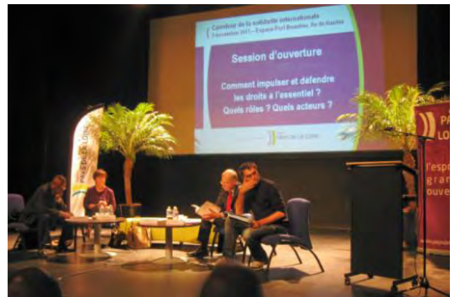
Forum du Conseil Régional Pays de la Loire