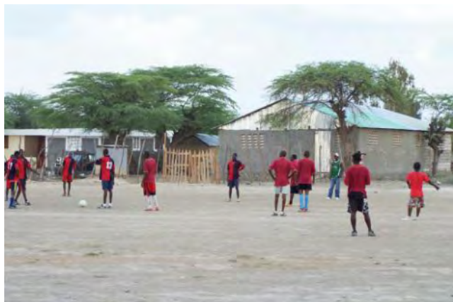
Entraînement de l'équipe de Desdunes sur le terrain de foot de « Machebwa » (Marché au bois)

Nos activités comportaient des sessions de travail en groupe, l'organisation d'un séminaire des acteurs de la commune et la participation aux réunions du CA de l'AFHAD Desdunes.