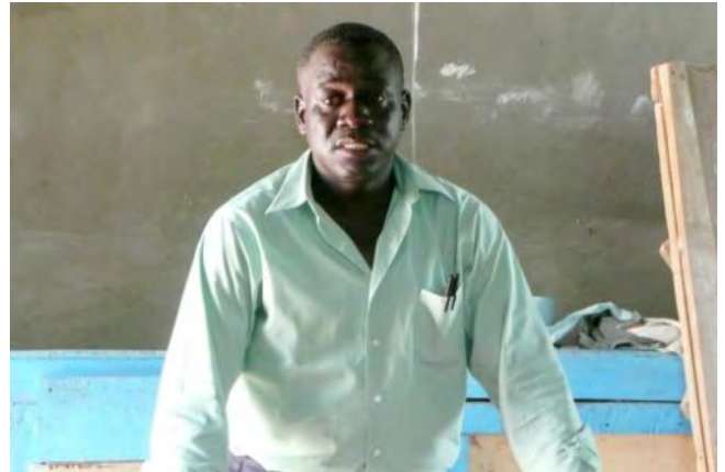
Mérisson présente un projet d'économie agricole lors du séminaire des chargés de projet

Ce sont des projets autonomes, dont les financements seront recherchés auprès des financeurs présents en Haïti.