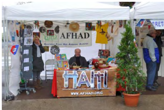
Semaine de la Francophonie

L'AFHAD présentait un stand au « Village de la Francophonie », place du Vieux Doulon. Une telle manifestation permet une bonne visibilité de l'association et est l'occasion de contacts avec les élus et des partenaires. Le professeur Amstrong fit une conférence: « Témoins au cœur du séisme » .