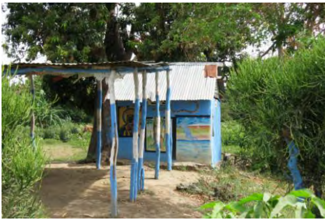
Temple Vaudou à Desdunes

En dehors des évidentes complexités d'ordre culturel et social, l'insuffisance de transparence et d'échange d'information parfois constaté avec (et entre) les haïtiens a été également une source de difficultés, les analyses de Nantes n'étant pas toujours partagées à Desdunes.