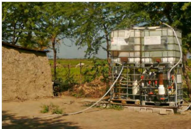
Installation de production d'eau potable au village de Modèle ... mais sans structure ni moyen de fonctionnement

Un volet technique qui prendra en compte les orientations élaborées lors du volet social. L'évaluation faite par les VSI, sur le terrain, en termes de ressources locales en approvisionnement de matériel et des coûts de maintenance, orientera nécessairement vers des systèmes « passifs », sans technologie. Ce deuxième volet débutera fin 2012, début 2013.