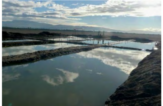
Les salines de la KOPAKOS

La finalité du projet est de permettre aux membres de la coopérative d'être solidairement propriétaires d'un outil de production et de s'assurer un salaire par la vente de la production de sel.