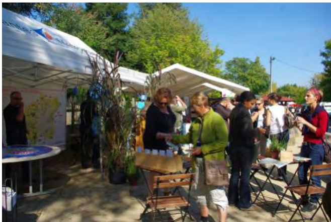
Dimanche au bord de l'eau

L'AFHAD a été sollicitée pour intervenir afin de présenter son action en Haïti. A la suite d'opérations réalisées par les élèves, le lycée de Talensac nous a remis un chèque de 200€ et l'école St Félix un chèque de 538 €.