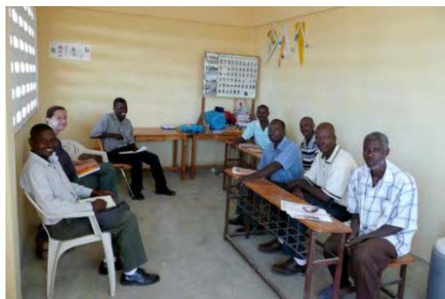
Aux Sources: concertation avec les représentants du Bureau du District Scolaire

En 2011, 3 écoles ont réalisé leurs travaux, pour un montant d'environ 11.000€ par école.