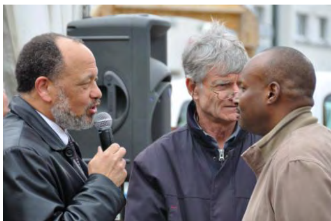
Rencontre et discussion avec les élus

Plateforme Ps-Eau. Une cinquantaine de personnes participaient à cette réunion, où la Direction Nationale pour l'Eau Potable et l'Assainissement en Haïti (DINEPA) présentait sa politique. Tout programme de réseau d'eau et d'assainissement en Haïti doit passer par cet organisme . Site: www.pseau.org